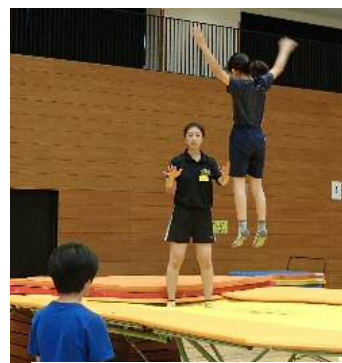
トランポリン体験