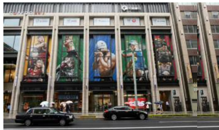
三井不動産（コレド日本橋）