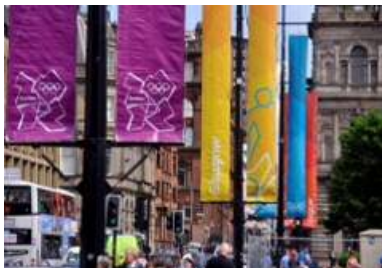
街灯路フラッグ（ロンドン大会）

過去のオリンピック・パラリンピック競技大会においても、フラッグの掲揚など様々なシティドレッシングが実施され、大会の盛り上げに寄与しました。