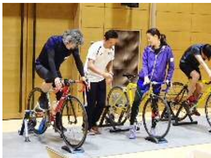
トライアスロン試乗会