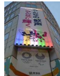
新宿区（区役所分庁舎）